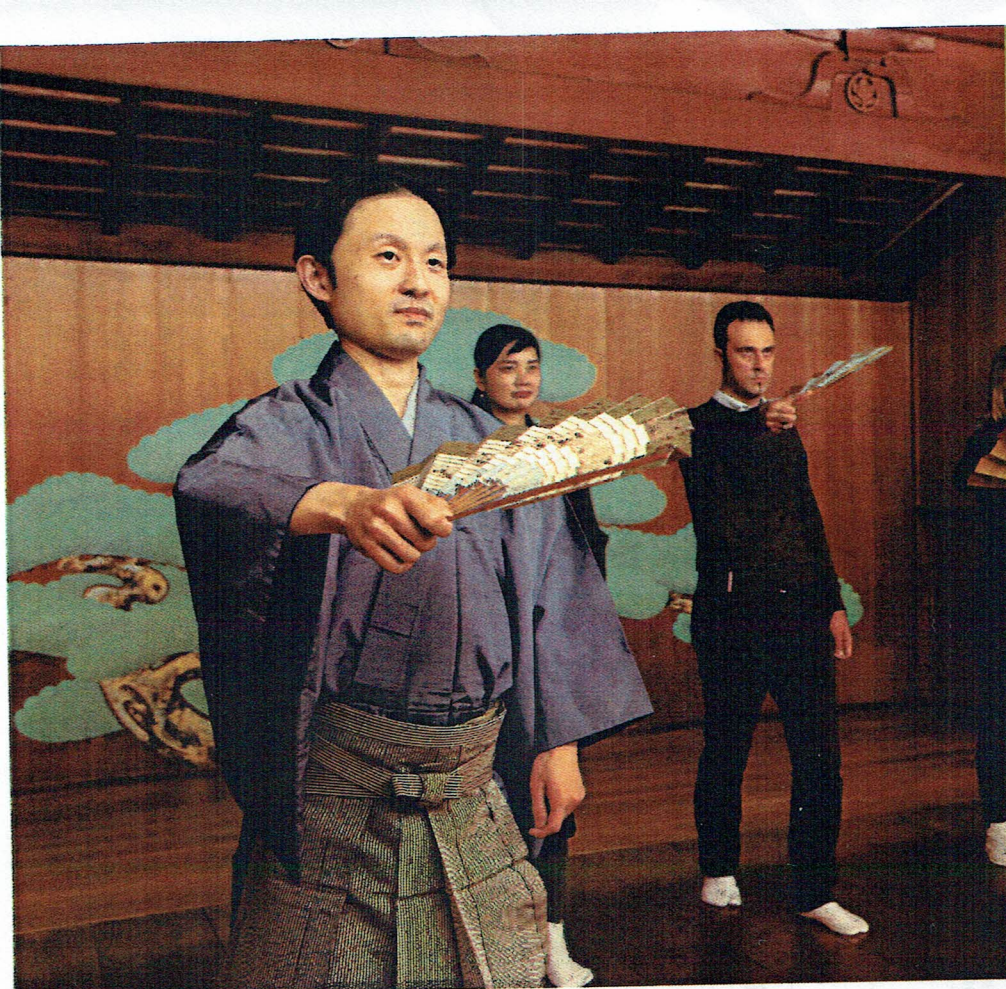
にんのうがくがくしゃ

9月開校 一般財団法人 仁和能楽學舎は、講師陣の御弟子さんやご縁のある方々限定に気軽に能楽に触れ学んでいただけるオンラインプレ講座 (zoom) を開講いたします。尚、この講座は9月開講前の体験講座となっています。本講座に興味のある方は下記をご覧ください。